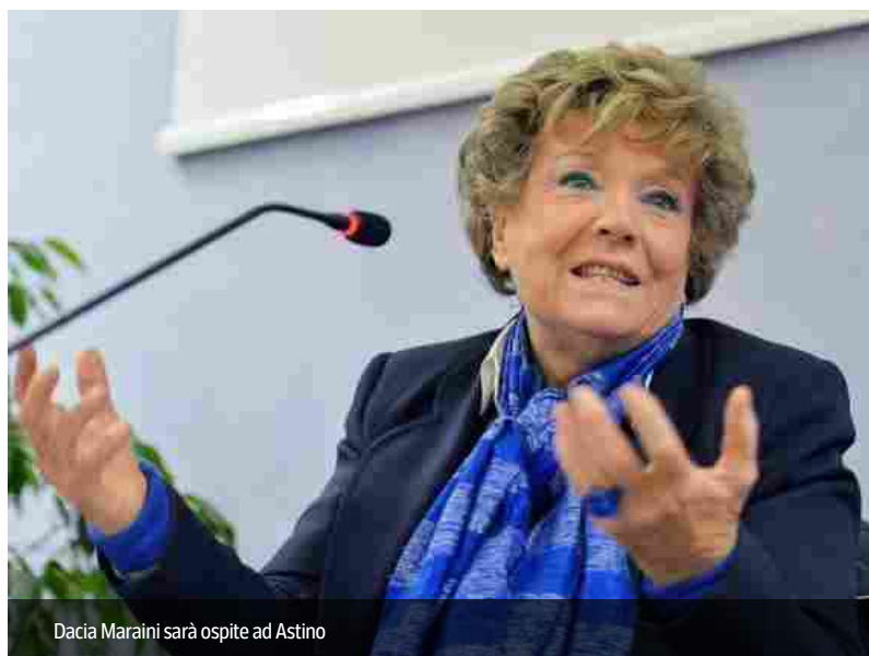
Dacia Maraini sarà ospite ad Astino

Partita la rassegna che porterà tanti intellettuali a discutere dei temi dell'oggi, a cominciare dal conflitto in Ucraina