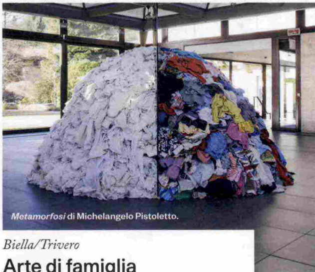
Metamorfosi di Michelangelo Pistoletto.