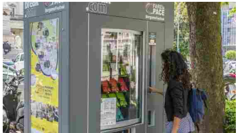
Il distributore di cultura

Fino al 7 giugno al Sentierone resta installata la macchinetta che dispensa le serigrafie e gli interventi scritti degli ospiti del festival Fare la pace