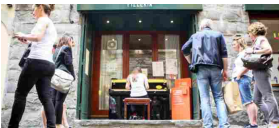
Com'è bella Bergamo al pianoforte Foto e video di una città in musica