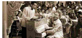
All'asta il pianoforte di Casablanca (lo sapevate che sono due?)