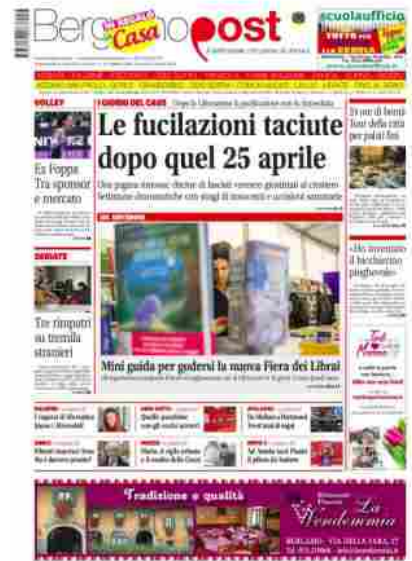
FOTO DEL GIORNO